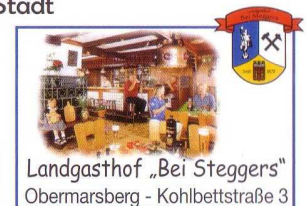
Landgasthof „Bei Steggers“ Obermarsberg - Kohlbettstraße 3